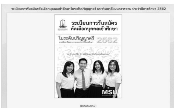
Figure 5 Original System

จากระบบการประชาสัมพันธ์ข้อมูลหลักสูตรแบบเดิม โดยการประชาสัมพันธ์ผ่านเว็บไซต์ ของข้อมูลหลักสูตรของคณะต่างๆ เป็นไฟล์ Portable Document Format : PDF ซึ่งเป็นรูปเล่มระเบียบการประชาสัมพันธ์ข้อเสียของรูปแบบเดิมคือมีข้อมูลที่มากเกินไปและไม่เป็นสัดส่วนของข้อมูลหลักสูตรการประชาสัมพันธ์แบบเดิมมีรายละเอียดดัง Figure 5