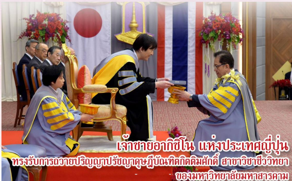
เจ้าชายอากิฮิโตะ แห่งประเทศญี่ปุ่น ทรงรับการถวายปริญญาปรัชญาดุษฎีบัณฑิตกิตติมศักดิ์ สาขาวิชาชีววิทยา ของมหาวิทยาลัยมหาสารคาม

ฉบับที่ 39 ประจำเดือน กันยายน – ธันวาคม 2561